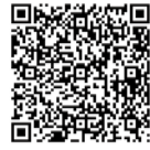
実施登録歯科医院